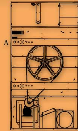
S45/60 A- Conexión eléctrica A- Electric connection